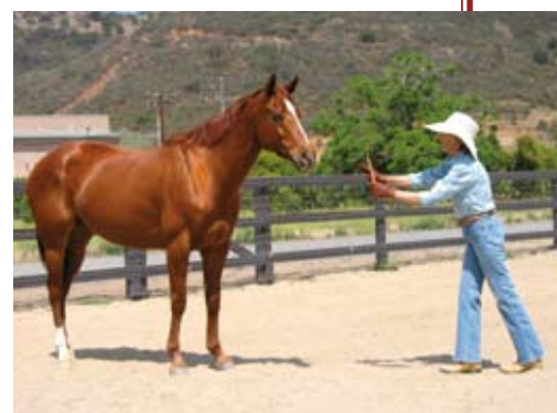
Quando la cavalla si avvicina a lei spontaneamente, le chiede di fermarsi e di rispettare la sua richiesta.